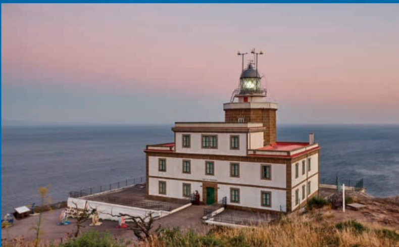
Faro de Fisterra