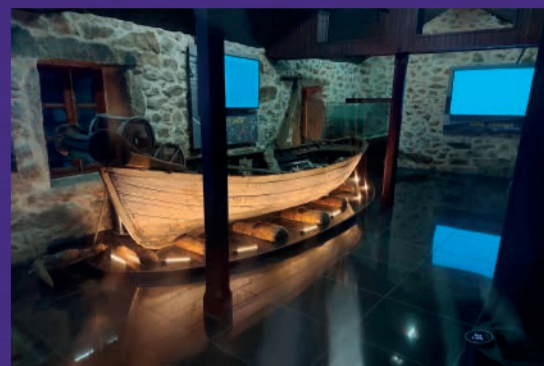
Museo Caseta Pepe do Cuco

Este tramo de la Costa da Morte alterna caminos costeros e interiores, cruzando aldeas con identidad gallega. Ofrece vistas tranquilas y mantiene un ambiente poco transitado.