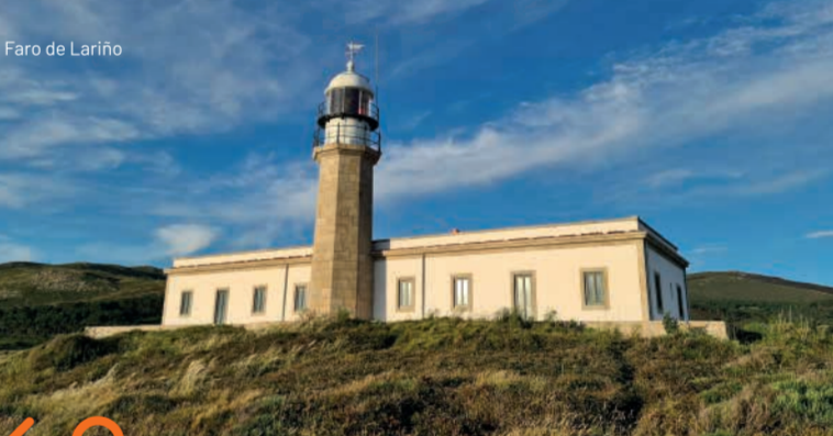
Faro de Lariño