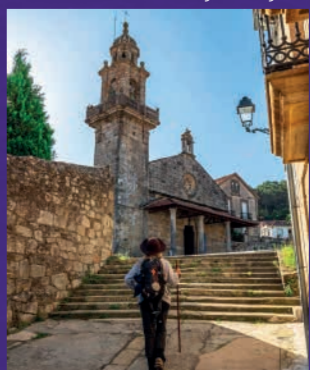
Muros. Iglesia de San Pedro (antigua Colegiata)

LEYENDA: En Louro, la Laguna de Xalfas se considera una ciudad sumergida castigada por la soberbia. De noche, se oyen campanas y quien las escuche tendrá fortuna para siempre.