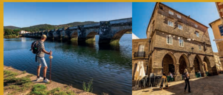
A Ponte Nafonso Noia

Esta etapa atraviesa bosques y aldeas, hay una ruta costera alternativa por A Barquiña para evitar zonas urbanas.