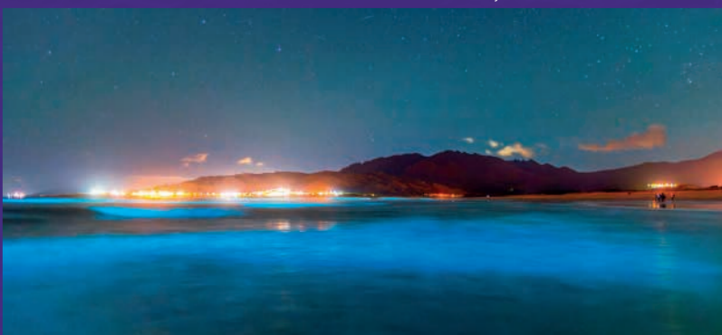
Playa de Carnota. Mar de Ardora

¡HAZ ESTA ETAPA DE NOCHE! Y DESCUBRE EL MAR DE ARDORA EN VOLTA DE GLORIA, un fenómeno natural único en el mundo que ilumina el mar con destellos azules durante las noches de verano. Un espectáculo de luz natural que ningún otro Camino puede ofrecer. ¡Vive esta experiencia mágica y exclusiva en Volta de Gloria!