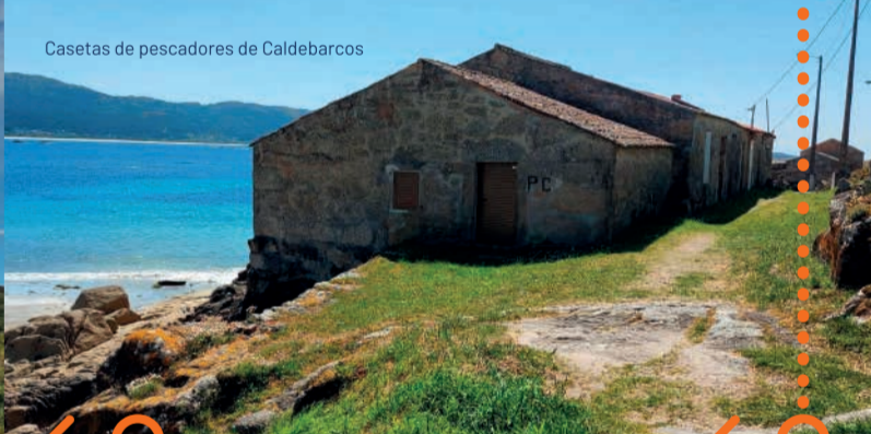
Casetas de pescadores de Caldebarcos

¡AVENTURA EN EL CAMINO! UN RETO NATURAL. En Caldebarcos, puedes seguir el recorrido oficial o cruzar la playa de Carnota, más directo pero condicionado por la marea. Boca do Río puede impedir el paso con marea alta, hay que cruzarlo con marea baja o en descenso. El tramo hasta el río dura 30-45 minutos, ¡conque planifica muy bien tu cruce!