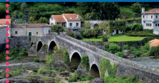
Ponte Maceira. Puente medieval

LEYENDA: En noches previas al 25 de julio, en Ponte Maceira se cuenta que un caballero venció a un dragón y construyó el puente como símbolo de protección y hospitalidad.